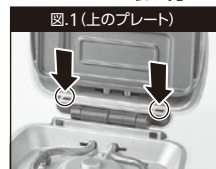
図.1(上のプレート) プレートの突起を、本体の図.1の○で囲まれた部分に差し込み、ツメがプレートロックに固定されるよう「カチッ」と音がするまで上から押します。