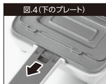
図.4(下のプレート) プレートロックボタンを手前にずらしてプレートロックを解除しプレートを手前に取り出します。

図.3(上のプレート) プレートロックボタンを上へずらしてプレートロックを解除しプレートを上に取り出します。