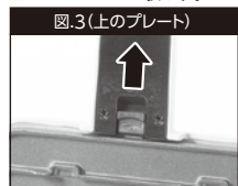
図.3(上のプレート) プレートロックボタンを上へずらしてプレートロックを解除しプレートを上に取り出します。