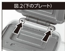
図.2(下のプレート) プレートの突起を、本体の図.2の○で囲まれた部分に差し込み、ツメがプレートロックに固定されるよう「カチッ」と音がするまで上から押します。

図.1(上のプレート) プレートの突起を、本体の図.1の○で囲まれた部分に差し込み、ツメがプレートロックに固定されるよう「カチッ」と音がするまで上から押します。